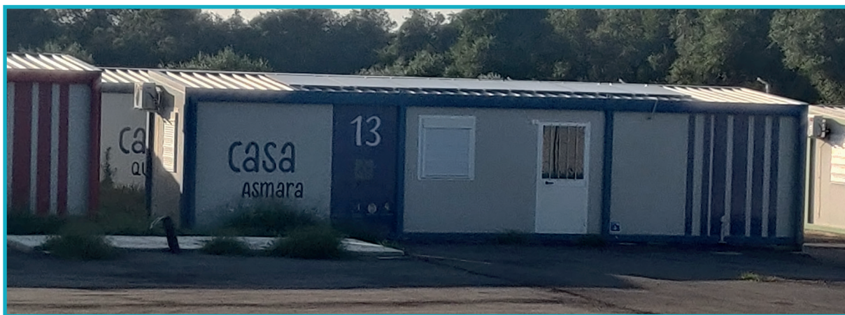
Il Borgo Solidale

In prossimità di Taurianova, Francesco ricorda di come durante il periodo di lockdown causato dalla pandemia del Covid 19, un insediamento dove vivono circa una ventina di persone fosse rimasto isolato senza acqua corrente. Mossi dalla situazione, dei vicini - autoctoni - avevano aiutato gli abitanti del ghetto ad allacciarsi al sistema idrico. In tutta risposta, il comune aveva denunciato i suoi cittadini per l'atto, lasciando nuovamente senza acqua l'insediamento. Mentre ci avviciniamo al luogo - che scopriamo essere di fatto una cascina abbandonata - Francesco ci racconta la storia del "Borgo solidale" di Contrada Russo. Si tratta di un villaggio fatto di container che dovrebbe accogliere cento braccianti. Il borgo si situa pochi metri più avanti, sulla destra dell'insediamento. I lavori sono iniziati nel 2021 e sono costati oltre 500 mila euro. Nell'agosto del 2023 però il Borgo è ancora disabitato. La struttura non può essere ancora aperta, perché nel progetto hanno dimenticato di inserire l'impianto elettrico. Quella che ci si para davanti è un'immagine paradigmatica, che Francesco chiama: "il modello Rosarno".