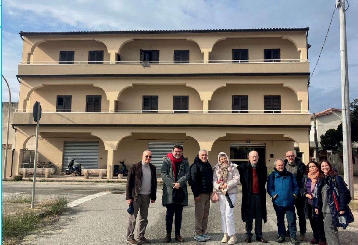
L'Ostello Dambe so

del conflitto all'eccessiva concentrazione di "stranieri" nella Piana di Gioia Tauro, sebbene questa stessa componente sia essenziale per la produzione agrumicola. La risposta istituzionale ricalca tale prospettiva. Dopo tre giorni di scontri il governo centrale indica alle forze dell'ordine di evacuare i migranti subsahariani dalla zona. I lavoratori vengono raccolti all'interno di pullman e portati nella capitale, dove vengono lasciati in stazione senza sostegno di alcun tipo, senza un luogo dove ripararsi né modi per sostentarsi 8 . A distanza di anni la condizione in cui versano i lavoratori stagionali – chiamati in Italia braccianti, da braccia – non è cambiata. Allo stesso tempo la rivolta, come un fantasma sempre presente, aleggia in ogni racconto ed ogni ricordo delle persone che abbiamo incontrato nella Piana, persone che ancora oggi lottano per una vita dignitosa e per il riconoscimento del lavoro bracciantile nel settore agrumicolo e non solo.