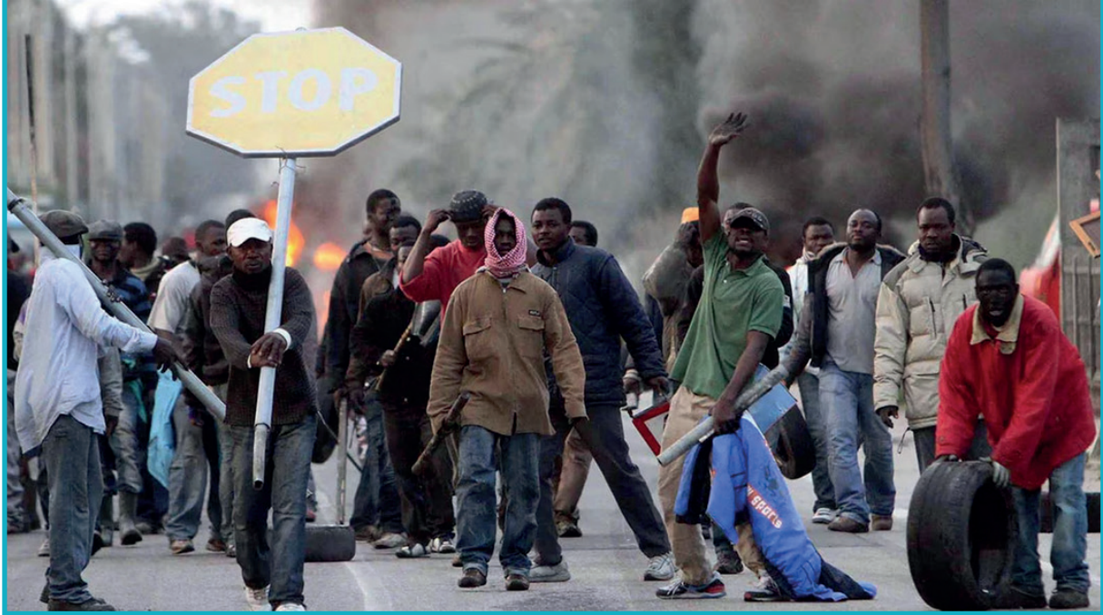
Scene di rivolta da Rosarno

che hanno visto contrapporsi da un lato la cittadinanza autoctona rosarnese, dall'altro i lavoratori stagionali di origine subsahariana 5 .