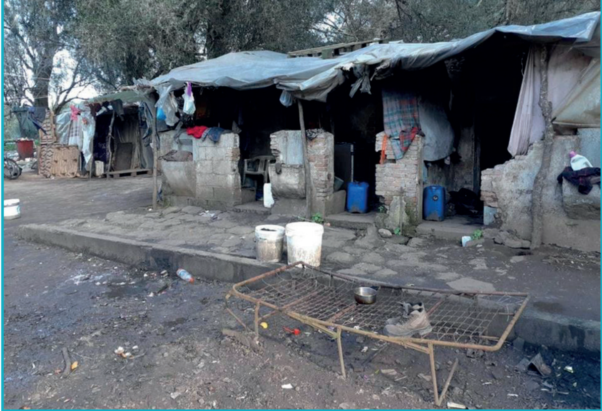
La baraccopoli di Rosarno

incendi - talvolta dolosi ma spesso causati dagli strumenti di fortuna utilizzati per scaldarsi - e altri incidenti che minano la sicurezza delle persone che li abitano.